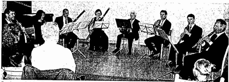
Begeisterten bei dem Konzert in der Schlosshof-Reihe: die „Würzburger Bläsersolisten“.

Franz Danzis Bläsersextett Es-Dur erwies sich als klangschönes, facettenreiches, stellenweise virtuoses, aber jederzeit optimistisches Werk der Frühromantik. Das Bläseroktett von Hans-Günther Allers beginnt lyrisch, mit herben Dissonanzen, aber nicht eigentlich atonal. Im Allegro wechselt